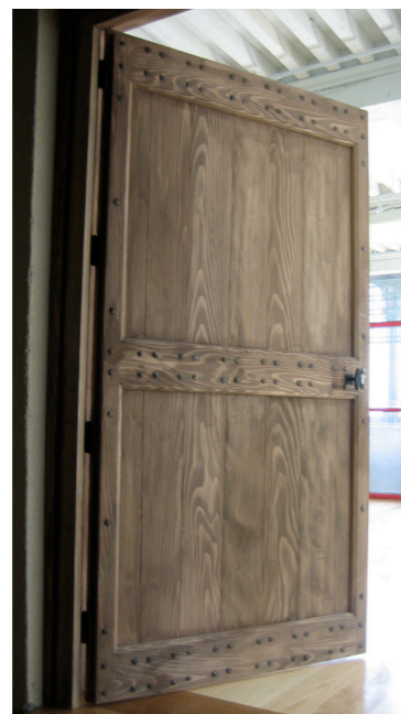
Vues intérieures de la Maison des Chanonges restaurées et aménagées : plafond dont la sous-face comporte des décors restaurés a été consolidé par une dalle en bois, le sol en carreaux de terre cuite rappelle l'ancien compartimentage du volume, le traitement résolument contemporain de certains détails est combiné à la restauration stricto sensu des vestiges hérités.