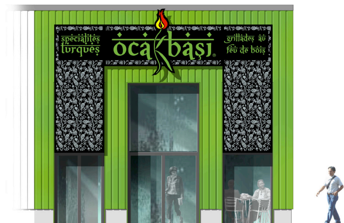
Vue de la cuisine de la devanture sur rue